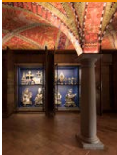
La sala in Art déco con singole vetrine.