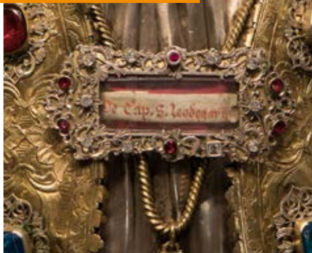
Il reliquiario del patrono di Lucerna San Leodegar.