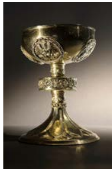
Le calice bourguignon.